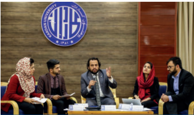
انجمن علوم سیاسی