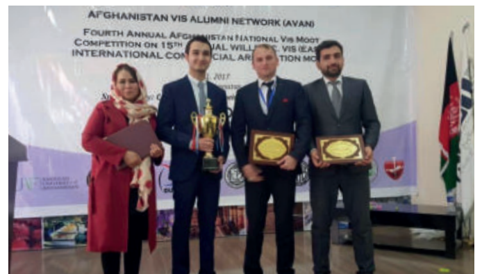
انجمن حکمیت تجاری