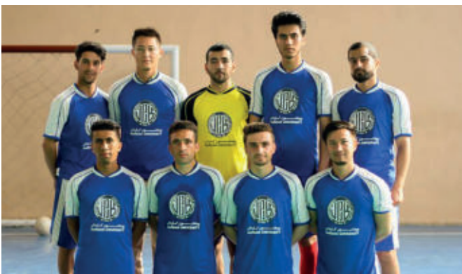
انجمن های ورزشی (فوتبال، والیبال و کرکت)