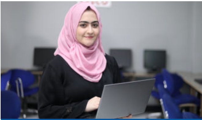
انجمن کمپیوتر ساینس