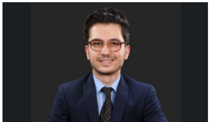
انجمن شبیه سازی سازمان ملل