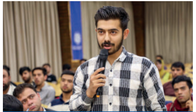
انجمن ژورنالیزم و ارتباطات عامه