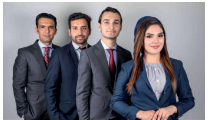
انجمن محکمه تمثیلی حقوق بین الملل (جی‌س‌پ)