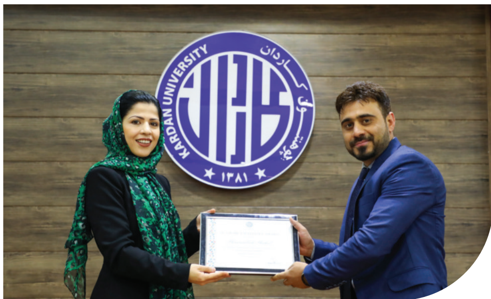
تقدیر از محصلان ممتاز پوهنتون کاردان

کمک های مالی به آنده محصلان اهداء میگردد که دارای مشکلات مالی بوده و توان پرداخت مکمل هزینه تحصیلات را ندارند.