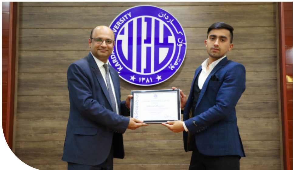
تقدیر از محصلان ممتاز پوهنتون کاردان