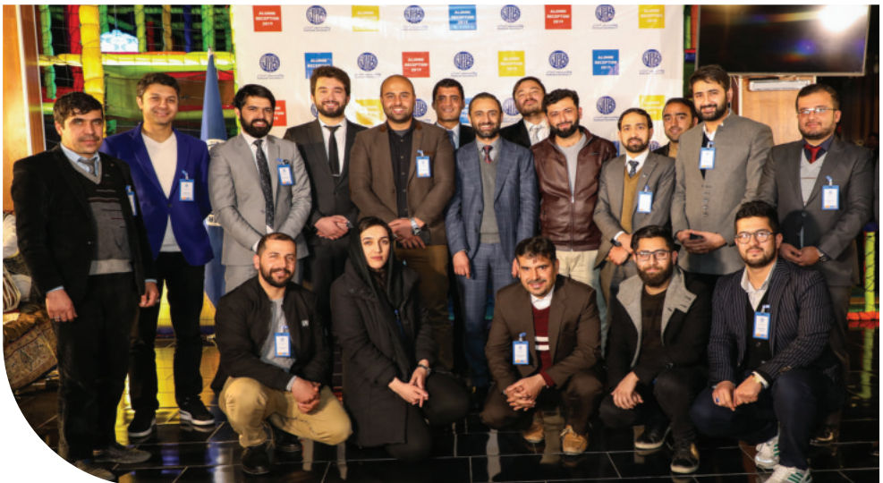
محفل تجلیل از اعتبار آکادمیک پوهنتون کاردان با حضور فارغان این پوهنتون