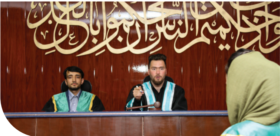
محصلان رشته حقوق حین اجرای محکمه تمثیلی