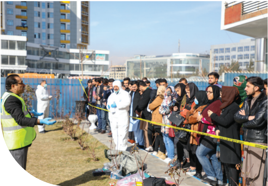
جریان آموزش عملی کریمناالتخنیك برای محصلان رشته حقوق پوهنتون كاردان