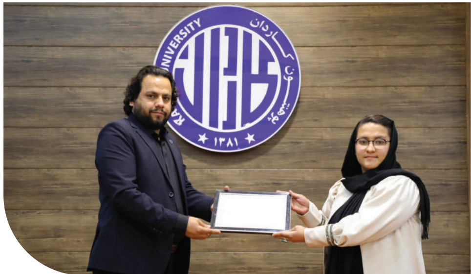
تقدیر از محصلان ممتاز پوهنتون کاردان