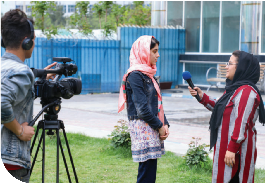
محصلان دیپارتمنت ژورنالیزم حین کار عملی

۵ - تربیت گرداننده گان برنامه های تحلیلی، گفتگوها، مناظره ها و گفتمان های سیاسی، اقتصادی، اجتماعی، فرهنگی و سایر برنامه های رادیویی و تلویزیونی.