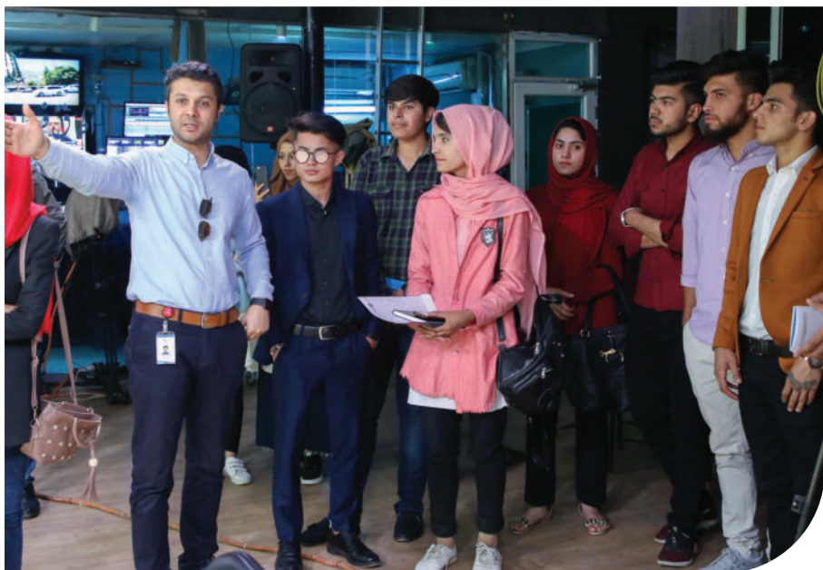
محصلان دیپارتمنت ژورنالیزم در جریان بازدید از فعالیت یکی از رسانه های کشور

۵ - تربیت کدرهای مسلکی برای بازاریابی، تهیه اعلانات و کپ های تجارتي و تبلیغاتی.