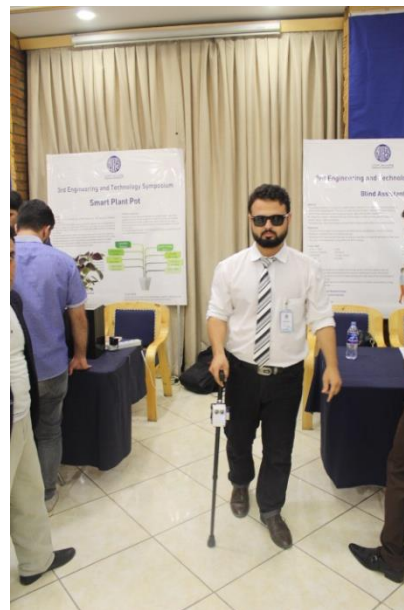
تصاویری از پروژه ها و جریان سومین سمپوزیم انجینیری و تکنالوژی پوهنتون کاردان